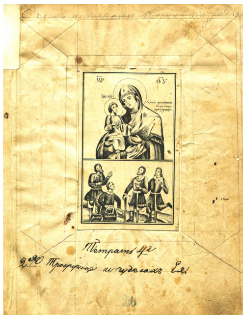
Илл. 1. Титульный лист тетради, содержащей описание чудес Белобережской иконы «Троеручицы» (ОР РНБ. Собр. П. Н. Тиханова. № 214. Л. 26)